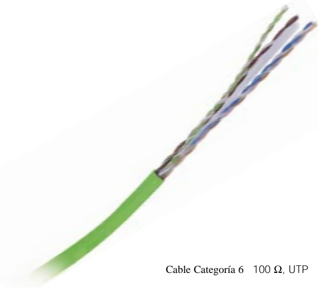
Cable Categoría 6 100 Ω, UTP

Perteneciente a la familia 3M™ Volition™ Network Solutions, este cable de 350 MHz UTP Categoría 6 le dará las mejores prestaciones cuando lo utilice con los conectores de 3M RJ45 K6, para dar los más altos márgenes sobre los estándares Categoría 6/TIA/EIA 568 e ISO 11801 y EN 50173 Clase E.